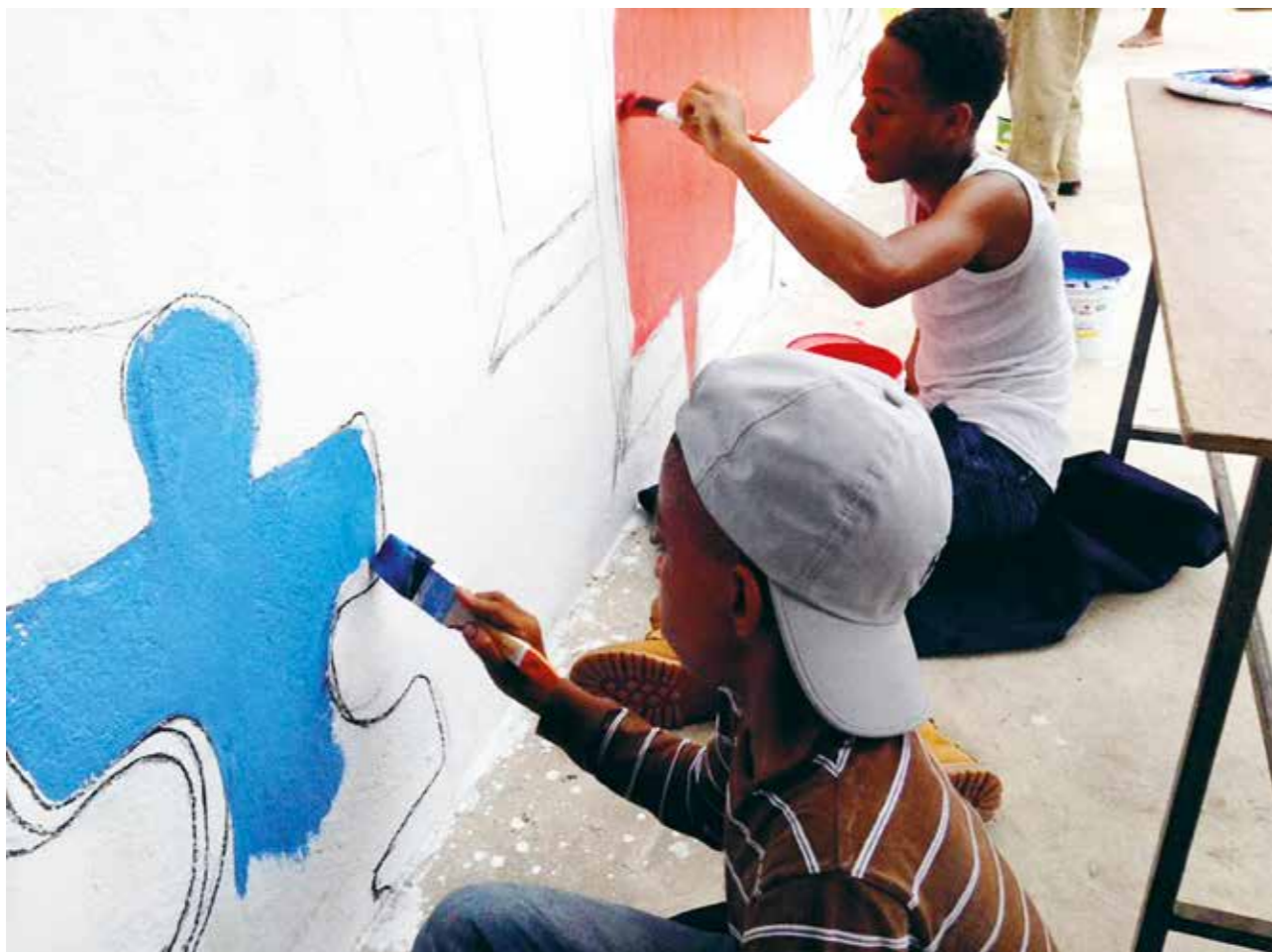
RÉALISATION D'UNE FRESQUE MURALE Kingston, 2016

Être entouré d'autres artistes nous encourage et nous donne la force de progresser dans notre voie. C'est comme cela que nous pouvons apprendre de manière sereine car nous faisons ce que nous aimons. Ce projet m'a beaucoup apporté, notamment sur le fait que nous avons tous notre propre manière d'apprendre. Mais c'est en reconnaissant ces différences et en identifiant les informations nécessaires pour atteindre nos objectifs que nous nous donnons les moyens de grandir individuellement.