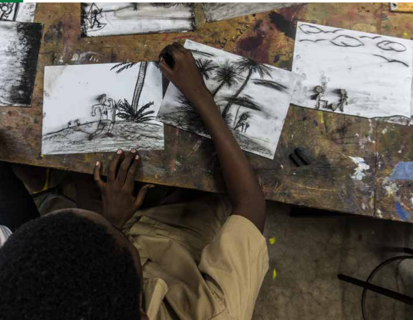
ATELIER DE DESSIN Kingston, 2017