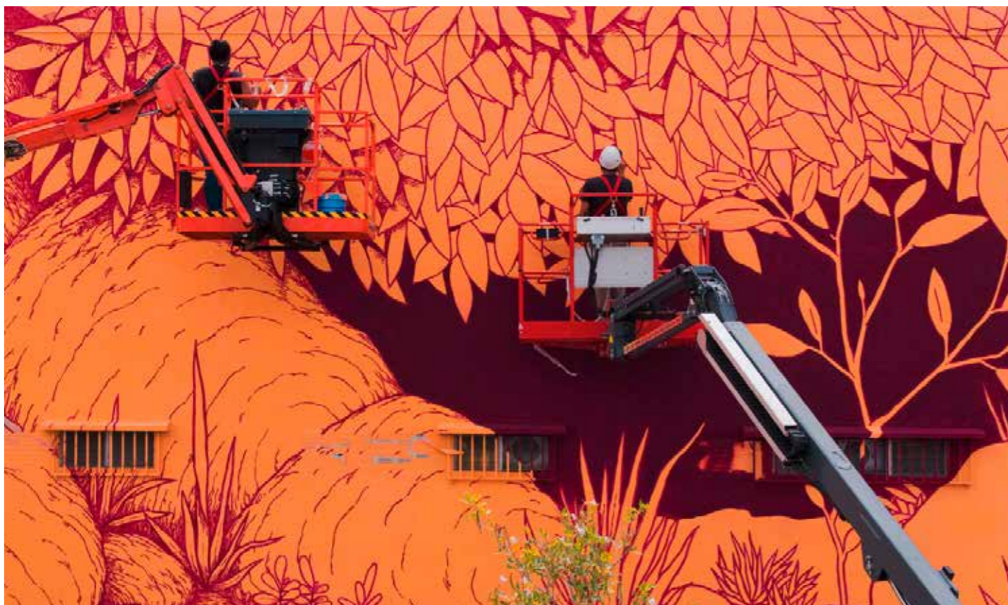
L'OREE LA SRPP, LA REUNION, 2017 Kid Kréol & Boogie

Soutien aux ateliers animés par le collectif réunionnais Kid Kréol & Boogie auprès des jeunes de la ville du Port autour d'un parcours menant à la fresque L'Orée (commande de Rubis Mécénat en 2017), organisés à l'occasion des 10 ans du collectif. En partenariat avec Village Titan et la ville du Port.