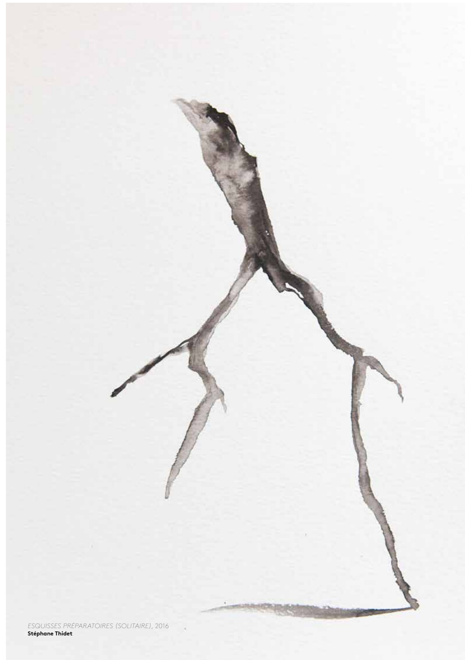
ESQUISSES PRÉPARATOIRES (SOLITAIRE), 2016 Stéphane Thidet