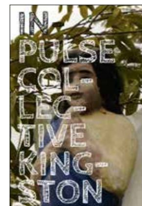
Livre InPulse Collective - Kingston, 2018

INPULSE COLLECTIVE – KINGSTON Catalogue présentant le projet InPulse et ses artistes (2016-2017)