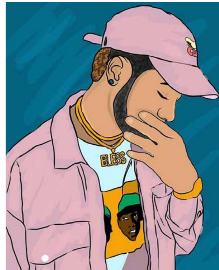
Animation réalisée par Andre Bowen, 2019

en 2019 son travail est présenté au sein de l'exposition collective du festival artistique InPulse à Kingston. En 2021, il participe en tant qu'assistant curatorial à l'exposition Re:mediate présentée au Clemente Center (New-York) par Tide Rising Art Projects.